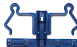
REF 690030 Gemaakt van kunststof