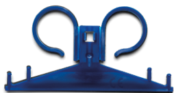
REF 690010 Gemaakt van kunststof